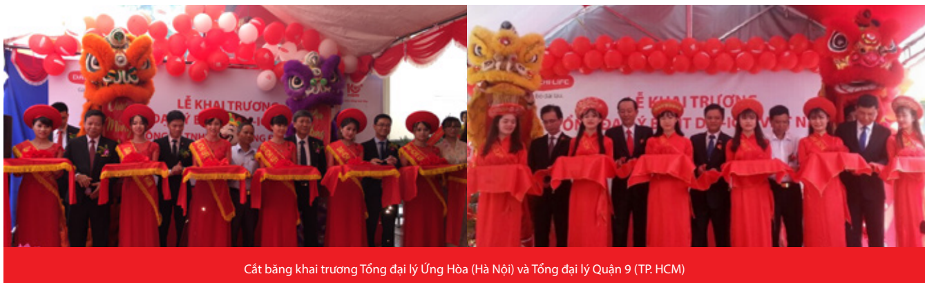
Cắt băng khai trương Tổng đại lý Ứng Hòa (Hà Nội) và Tổng đại lý Quận 9 (TP. HCM)

Với triết lý kinh doanh "Tất cả vì con người", Dai-ichi Life Việt Nam luôn tiên phong trong các hoạt động từ thiện, xã hội và hướng đến sự phát triển bền vững của cộng đồng địa phương. Nhân dịp khai trương các văn phòng Tổng đại lý, Dai-ichi Life Việt Nam đã trao tặng tại mỗi địa phương 20 suất học bổng trị giá 10 triệu đồng, nâng tổng số tiền lên đến 200 triệu đồng.