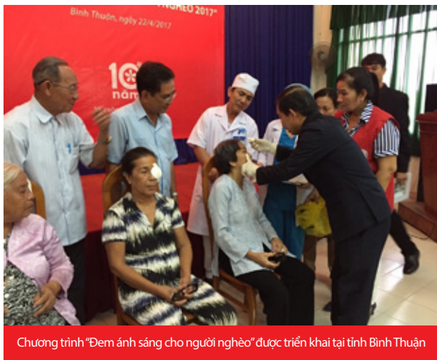
Chương trình “Đem ánh sáng cho người nghèo” được triển khai tại tỉnh Bình Thuận

Ngoài ra, Quỹ “Vì cuộc sống tươi đẹp” cũng triển khai chương trình Hiến máu nhân đạo tại Đắk Lắk, Hà Nội, Quảng Nam với gần 137.000 ml máu được hiến tặng.