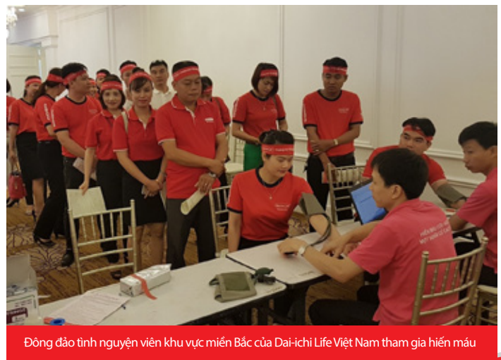
Đông đảo tình nguyện viên khu vực miền Bắc của Dai-ichi Life Việt Nam tham gia hiến máu